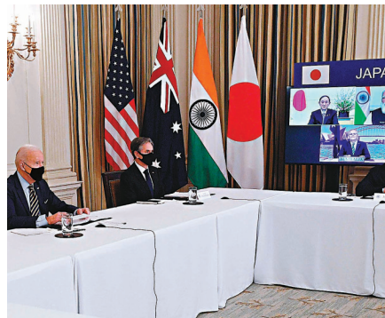
美、日、澳、印「四方安全對話」12日舉行視像峰會。

香港文匯報訊 綜合報道，由美國、日本、澳洲和印度組成的「四方安全對話」12日舉行視像峰會，根據官方聲明，4國領導人在會議上強調實現印太地區穩定，並討論到新冠疫情等議題，包括商定合力協助印度生產疫苗，並向東南亞等地的國家分發，等同推動「疫苗外交」。