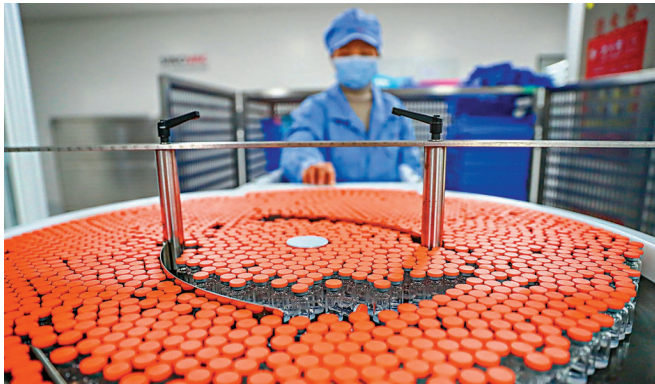
國際標準下通行使用的中硼硅玻璃疫苗瓶我國產率不足10%。圖為工作人員在科興中維新冠疫苗包裝車間內工作。資料圖片