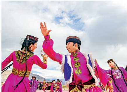
新疆民眾在節日盛裝起舞。資料圖片

陳旭指出，過去60多年，新疆經濟總量增長了200多倍，人均預期壽命從30歲提高到72歲，過去40多年，新疆維吾爾族人口從555萬增長到1,200多萬，翻了一番。「種族滅絕」在社會主義中國根本不可能發生。