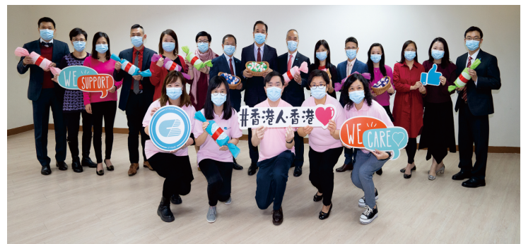
港基義工親手製作近四萬份手工藝禮物贈予有需要人士。

【香港商報訊】港基物業管理有限公司(港基)一向關愛社區，熱心回饋社會；於2005年成立的「港基愛心義工隊」多年來參與及支持各式各樣的社區及義工活動。雖然去年因疫情關係，不少義工活動被迫取消，但「港基愛心義工隊」善心不變，積極透過不同渠道向有需要社群傳達關愛，累積服務時數逾13,000小時，並已連續13年榮獲社會福利署推廣義工服務督導委員會及義務工作發展局頒發「壹萬小時義工服務獎」，同年更獲得「香港義工團(商界團體)最高服務時數獎-銀獎」及「香港義工團(商界團體)最高參與率獎-銀獎」之殊榮。此外，港基亦有99名義工獲以上機構頒發個人義務工作卓越金、金、銀及銅獎狀榮譽。