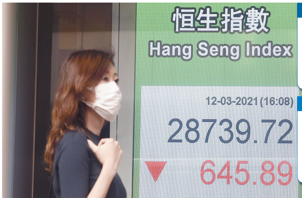
港股昨高開低走，尾市越跌越急，收報28739點，跌645點或2.2%。

【香港商報訊】記者吳天淇報道：美債息率再度抽升，加上騰訊(700)及阿里巴巴(9988)再傳面臨監管，內外夾擊之下，港股昨高開低走，尾市越跌越急，收報28739點，跌645點或2.2%，再失29000點大關。全周計恒指累跌358點，跌幅1.23%；科指累跌177點或2.05%。