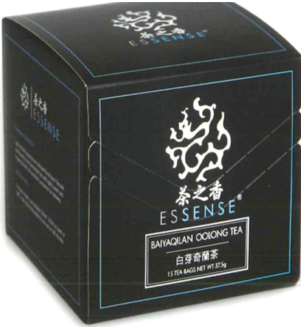
茶之香ESSENSE出品的白芽奇蘭茶於首屆香港國際茶展，勇奪青茶組冠軍。

茶之香ESSENSE產品包裝具現代感又大方優雅，質素更是精益求精，務求成爲新生代茶藝產品的品味之選，當中的白芽奇蘭茶於首屆香港國際茶展，勇獨青茶組冠軍。於茶展中，茶之香ESSENSE攤位極受歡迎，中外嘉賓也前往試飲，查詢資料、流連端詳良久。第三天的公眾場更是人頭湧湧，員工幾乎應接不暇。