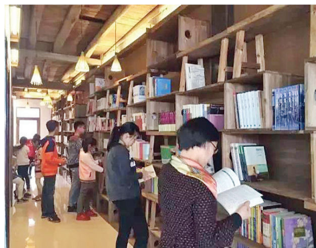
這裏是孩子們的精神樂園，這裏是村民們的半個家，這裏就是嵩口人氣最旺的地方之一——福州市永泰縣嵩口社區公益圖書館。

未來，拗九節將融入時代精神，這碗粥將更有溫度，更能滋養文明，讓福州的拗九節成為中國的拗九節，讓傳統節日散發出其獨有的文化魅力，讓孝親文化深深根植於全國人民的心中，外化為千家萬戶的感恩之行。 (邱陵 藍瑋萍)