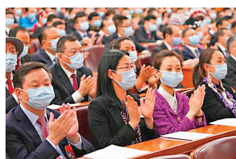
●閉幕會上，每項決議草案和決定草案表決通過後，現場都會響起熱烈掌聲。