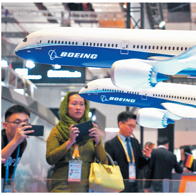
●李克強強調，中美兩國有着廣泛的共同利益，有許多可以合作的領域。圖為2019年進博會，人們在美國波音公司展台參觀。

李克強強調，中美兩國有着廣泛的共同利益，有許多可以合作的領域。在去年多重重擊的背景之下，中美兩國的貿易規模仍然達到4.1萬億元人民幣，增長8.8%，我們還是應當把更多精力放在共同點上，去擴大共同利益。中美兩國作為聯合國的常任理事國，對於維護世界和平穩定、促進世界繁榮發展，都有重要責任。應該推動中美關係越過坎坷往前看，向着總體穩定的方向走。