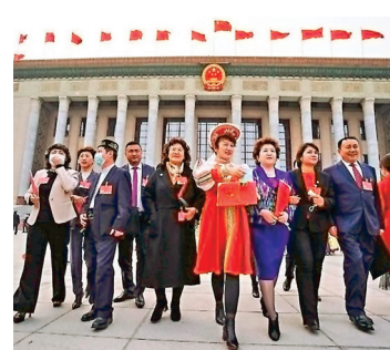
●閉幕會後，代表們走出大會堂。