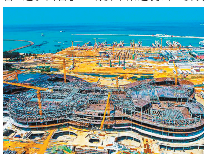
●2021年3月5日，建設中的海口國際免稅城項目，未來將成為海口新地標。

綱要草案提出，要制定促進共同富裕行動綱要。兩會期間，國家發展改革委副主任胡祖才在國新辦新聞發布會上這樣闡述共同富裕：「全民共富+全面共富+共建共富+逐步共富」。綱要草案還提出，要支