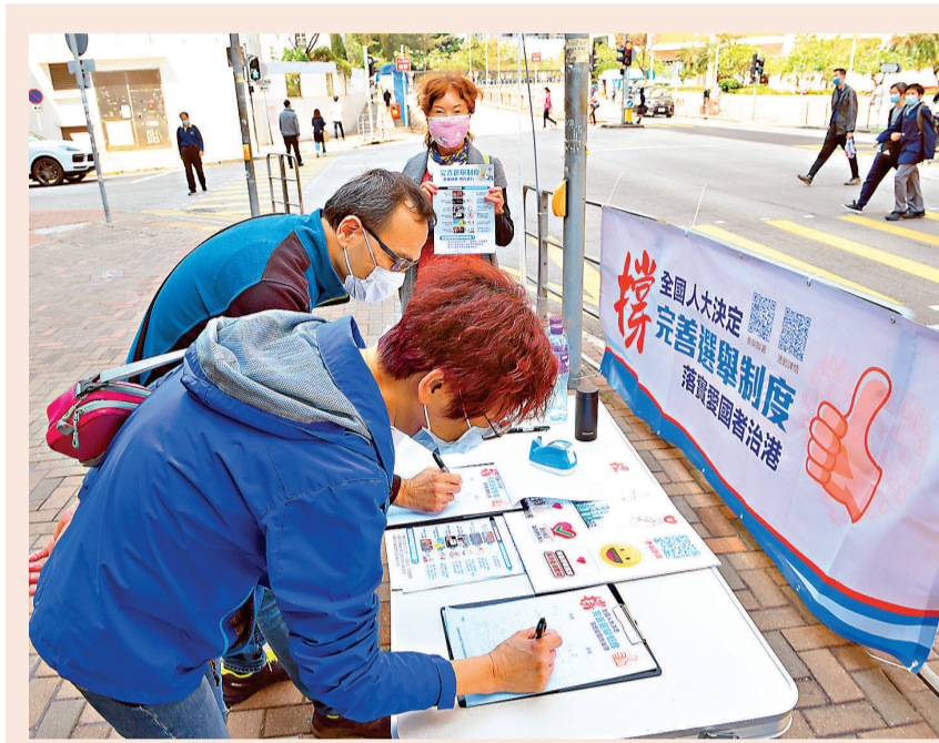
港人踴躍簽名聯署挺決定

完善香港選舉制度五點重要意義 ●是修補香港特別行政區法律制度漏洞和缺陷的必要之舉，有利於完善「一國兩制」制度體系。 ●是維護香港特別行政區政治穩定和政權安全的治本之策，有利於香港實現長治久安。 ●是立足香港的實際情況作出的適當選擇，有利於推進香港的民主制度循序漸進、穩健發展。 ●是提高政府治理效能的必由之路，有利於發展經濟、改善民生。 ●是落實「愛國者治港」原則的制度保障，有利於「一國兩制」實踐行穩致遠。