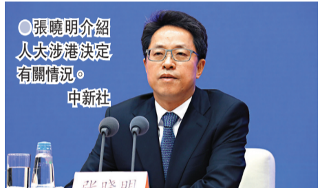
張曉明介紹人大涉港決定有關情況