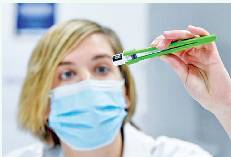
2020年12月27日,欧盟多个成员国正式启动新冠疫苗接种工作。图为比利时医护人员正在准备新冠疫苗接种工作。

种造成这些情况的出现,这些情况并未列为这支疫苗的副作用。”该管理局还称,“这支疫苗目前仍是利大于弊,在持续调查血栓事件病例的同时,