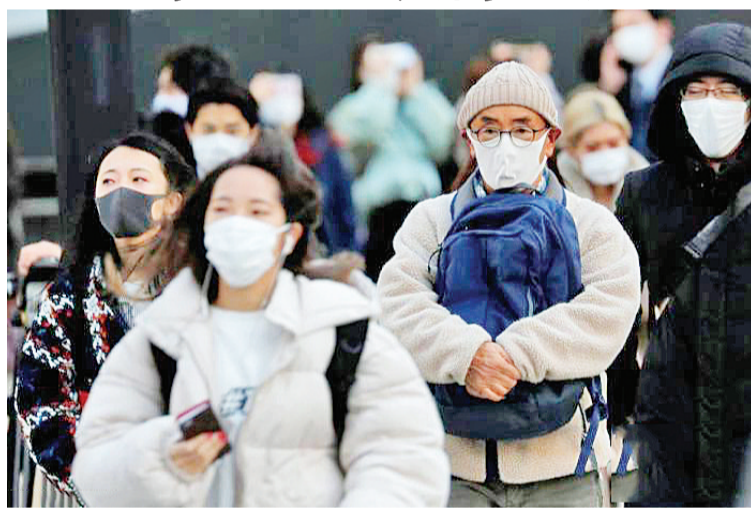
当地时间1月7日,日本东京,民众佩戴口罩上街。

中新网东京3月12日电 日本国土交通大臣赤羽一嘉12日在东京表示,为防止变异新冠病毒的流入,日本将对入境者人数设置每日2000人的上限。