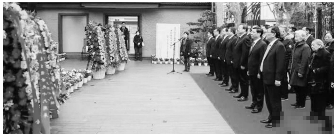
3月12日,中国民主革命伟大先行者孙中山先生逝世96周年纪念活动在位于上海香山路孙中山故居内举行。

中新网上海3月12日电 中国民主革命伟大先行者孙中山先生逝世96周年纪念活动12日在位于上海香山路的孙中山故居内举行。 孙中山故居庭院中央,摆放着上海市人民政府、上海市政协、中共上海市委统战部、民革上海市委和中国福利会等敬献的花篮。各界代表在孙中山先生铜像前肃立并三鞠躬,深切缅怀革命先辈的不朽业绩。 当天,由上海宋庆龄研究会指导,上海市孙中山宋庆龄文物管理委员会与中山陵园管理局联合主办、上海孙中山故居