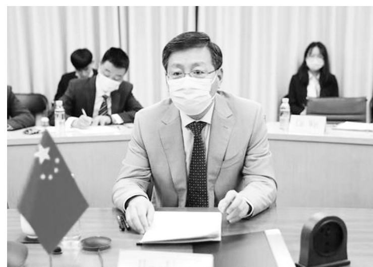
现地局势进一步缓和,共同维护边境地区来之不易的和平稳定局面。

2021年3月12日,中国外交部边界与海洋事务司司长洪亮同印度外交部东亚司辅秘史耐恩以视频方式共同主持中印边境事务磋商和协调工作机制第21次会议。两国外交、国防、移民等部门代表参加。双方积极评价两国一线部队在班公湖地区脱离接触成果,就推动解决中印边境其他地区问题坦诚深入交换了意见,同意按照两国外长莫斯科会晤达成的五点共识和2月25日通话精神,稳控中印边境局势,避免现地局势出现反复。双方同意继续通过外交和军事渠道