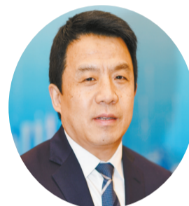
全國人大代表、江蘇省泰州市委書記史立軍

【香港商報訊】記者杜林報導：3月8日，全國人大代表、江蘇省泰州市委書記史立軍在京接受採訪時表示，為了進一步推進長三角區域一體化，不斷完善區域高鐵路網布局，最大程度發揮京滬二通道的綜合效益，充分利用長江過江通道資源，建議進一步加快規劃建設淮泰鐵路。