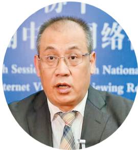
全國政協常委、民進湖南省委副主委、湖南省生態環境廳副廳長潘碧靈

【香港商報訊】全國政協常委、民進湖南省委副主委、湖南省生態環境廳副廳長潘碧靈呼籲，水體中抗生素污染問題必須引起重視並加強治理。