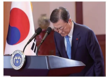
圖為：韓國總統文在寅

3.中非國家赤道幾內亞最大城市巴塔一軍營發生大爆炸，截至目前已至少造成20人喪生，另有600餘人受傷。赤道幾內亞總統奧比昂表示，爆炸原因為“炸藥處理不當”。