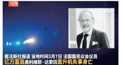
據法新社報道，當地時間3月7日，法國國民議會議員億萬富翁奧利維耶·達索因直升機失事身亡

5.當地時間3月7日，法國國民議會議員、億萬富翁奧利維耶·達索因直升機失事身亡，馬克龍發文哀悼“這是法國巨大損失”。