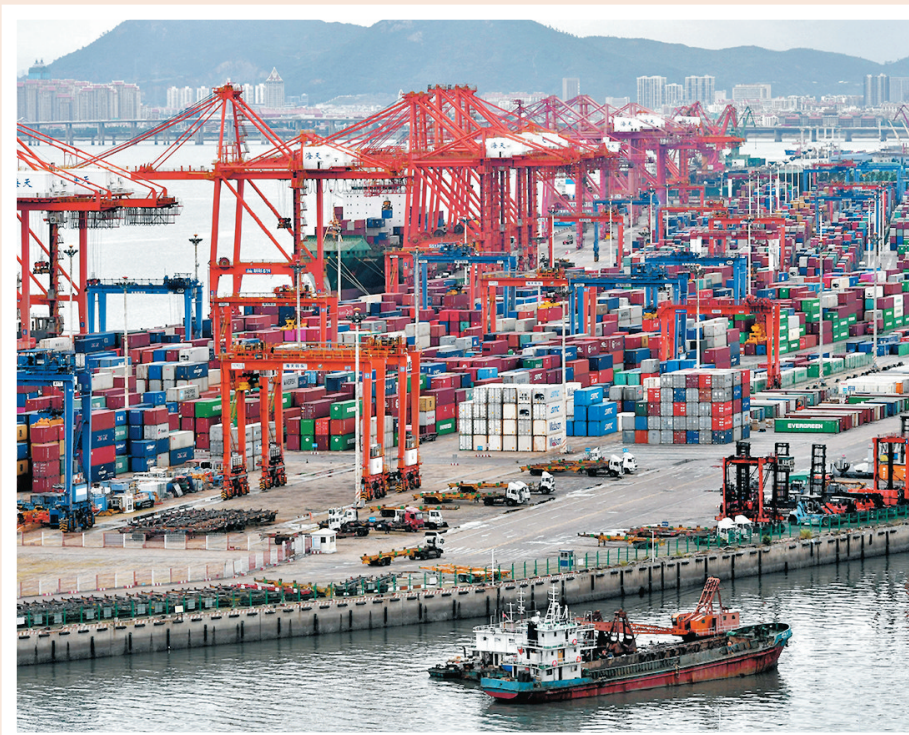
●受惠於歐美等主要經濟體消費復甦，對中國產品需求增加，今年首兩月中國出口錄得強勁增長。