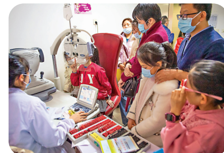
不少家長擔憂長期上網課影響孩子視力。資料圖片