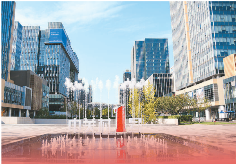
▲ 位于北京市海淀区的中关村壹号园区，创新生态正不断外展，企业创新投入持续增加，吸引海归人才落地创业。图为该园区外景。

一项项惠企政策、一份份民生福利，展示出中国对经济社会持续健康发展的信心，回应着人民群众对美好生活的向往。海归人员纷纷表示，机遇难得，追梦奋斗正当其时，自己要发挥优势、开拓进取，在未来五年为祖国发展献智献力。