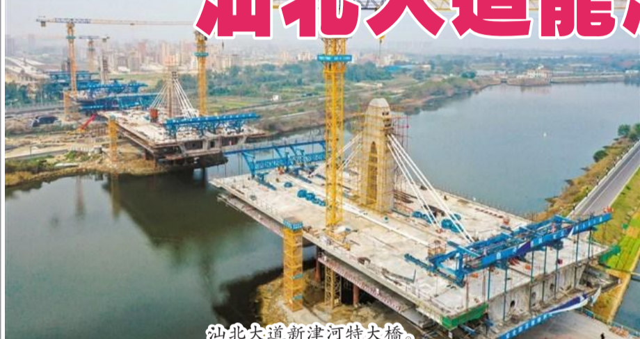
汕北大道新津河特大橋。

後，從大年初三開始關鍵控制性工程提前組織復工，目前全綫各作業面已100%復工。 作為項目控制性工程，新津河特大橋為國內罕見、粵東首座五塔寬幅單索面矮塔斜拉橋，全長約2.2千米，主橋全長616米。大橋跨越新津河和汕汾高速公路，往西下穿鐵路後與市區泰山-黃河互通立交相連接，並設立辛龍互通與龍湖區辛厝寮片區道路連接；往東與新溪昆侖山路相互連通。截至目前，新津河特大橋已順利完成橋梁下構施工，東西兩岸引橋全部架梁完成。主橋5座主塔月底全部封頂，正進行主橋大跨徑寬幅懸臂掛籃施工和主塔掛索施工，整體化層完成30跨，防撞護欄完成16跨，計劃7月底主跨率先合龍。 全長1.2千米的東興路跨綫橋為陸地高架橋，汕北大道龍湖段在進入新溪片區後，跨越東興路跨綫橋穿過新溪和外砂片區，直達外砂河邊。目前東興路跨綫橋主體結構全部完成，正在進行橋面系及附屬工程施工，防撞護欄已完成73%。 外砂河特大橋全長約1.8千米，上跨外砂河和萊美路，對