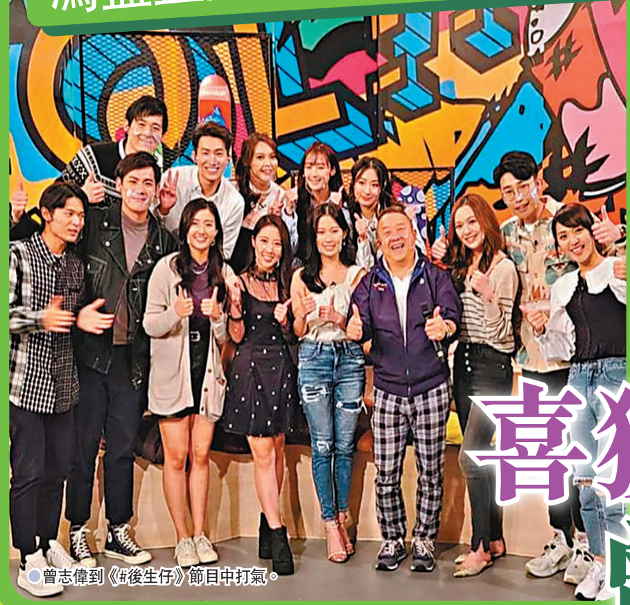
曾志偉到《#後生仔》節目中打氣。

香港文匯報訊(記者 阿祖)無綫清談節目《#後生仔傾吓偈》(簡稱: #後生仔)走年輕人路線,從2017年播出至今頗受觀眾歡迎,由於部分內容出位而成為網民的「花生」熱話。最近有傳《#後生仔》或被取代,主持陸浩明近日上傳曾志偉上節目的照片,似乎是以行動粉碎有關的傳聞。一向言行出位的另一主持馮盈盈近日則自稱約滿「離巢」,引起外界關注。