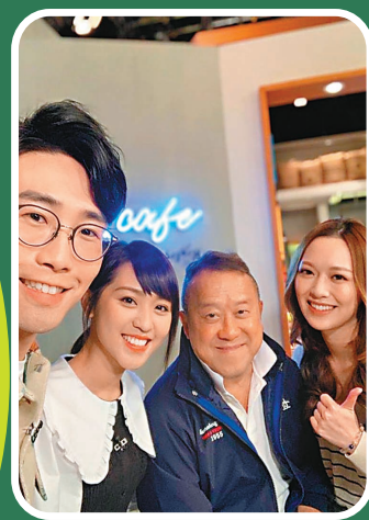
曾志偉跟一眾主持合照。

香港文匯報訊(記者 阿祖)無綫清談節目《#後生仔傾吓偈》(簡稱: #後生仔)走年輕人路線,從2017年播出至今頗受觀眾歡迎,由於部分內容出位而成為網民的「花生」熱話。最近有傳《#後生仔》或被取代,主持陸浩明近日上傳曾志偉上節目的照片,似乎是以行動粉碎有關的傳聞。一向言行出位的另一主持馮盈盈近日則自稱約滿「離巢」,引起外界關注。