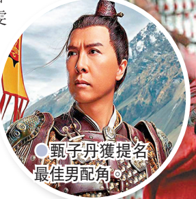
甄子丹獲提名最佳男配角。

香港文匯報訊(記者 文芬)2021年第46屆美國電影土星獎(The Saturn Awards)近日公布提名,劉亦菲和其主演的電影《花木蘭》喜獲6項提名。今次劉亦菲憑借電影《花木蘭》獲最佳女主角提名,將與妮妲莉寶愛(Natalie Portman)、查理絲花朗(Charlize Theron)及瑪歌羅比(Margot Robbie)等勁敵爭影后。這亦是繼評論家超級選擇獎(Critics' Choice Super Awards)及兒童選擇獎(Kids' Choice Award),劉亦菲獲得的第三個北美重要影后提名。值得一提,甄子丹亦憑《花木蘭》獲提名最佳男配角。《花木蘭》其他提名還包括最佳動作/冒險電影、最佳導演、最佳電影劇本,以及最佳服裝設計。