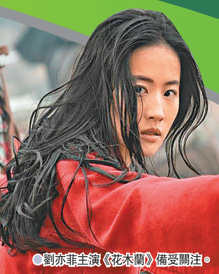
劉亦菲主演《花木蘭》備受關注。