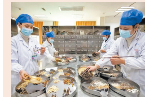
●中西醫結合、中西藥並用，是這次疫情防控的一大特點。習近平表示，要做好中醫藥守正創新、傳承發展工作。