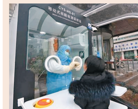
●習近平對醫務工作者牽掛殷殷。他表示，要加強對醫務工作者的保護、關心、愛護，依法嚴厲打擊醫鬧和暴力傷醫行為。