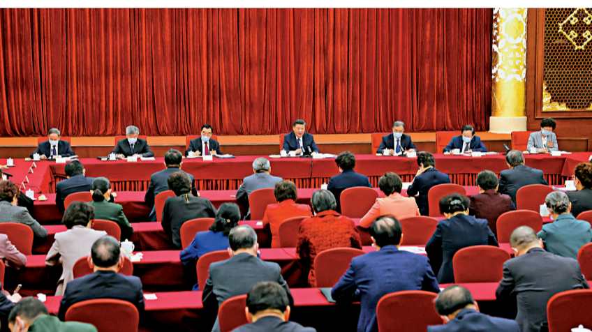
●3月6日，習近平看望參加政協會議的醫藥衛生界、教育界委員。

香港文匯報訊 據新華社報道，中共中央總書記、國家主席、中央軍委主席習近平3月6日下午看望了參加全國政協十三屆四次會議的醫藥衛生界、教育界委員，並參加聯組會，聽取意見和建議。他強調，要把保障人民健康放在優先發展的戰略位置，堅持基本醫療衛生事業的公益性，聚焦影響人民健康的重大疾病和主要問題，加快實施健康中國行動，織牢國家公共衛生防護網，推動公立醫院高質量發展，為人民提供全方位全周期健康服務。要全面貫徹黨的教育方針，堅持社會主義辦學方向，堅持教育公益性原則，着力構建優質均衡的基本公共教育服務體系，建設高質量教育體系，辦好人民滿意的教育，培養德智體美勞全面發展的社會主義建設者和接班人。