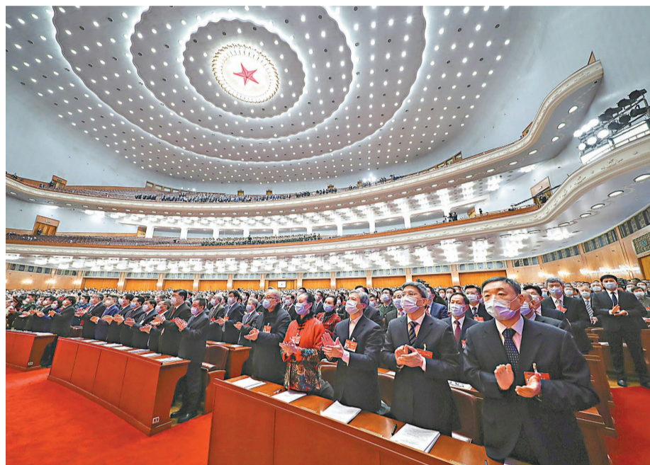
●3月4日，中國人民政治協商會議第十三屆全國委員會第四次會議在北京人民大會堂開幕。 新華社

他寄語委員，「雄關漫道真如鐵，而今邁步從頭越」，為奪取全面建設社會主義現代化國家新勝利、實現第二個百年奮鬥目標，作出新的更大貢獻。