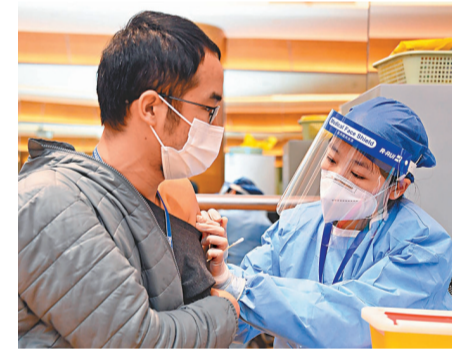
●目前，中國正按照區分輕重緩急、穩妥有序推進的原則開展新冠疫苗接種。