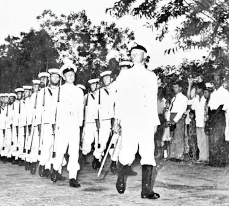
1968年,苏哈托访问澳大利亚

下,印度尼西亚债权国会议于1967年2月首次召开。从此到1991年间,两国共计主导召开了34次会议,向印尼提供了五百多亿美元的援助。其中美国与日本占据了大部分,特别是日本援助金额迅速增长,1967年时一年仅援助6000万美元,但到1973年一年加码到了2亿多美元,比美国还要多将近9000万美元。