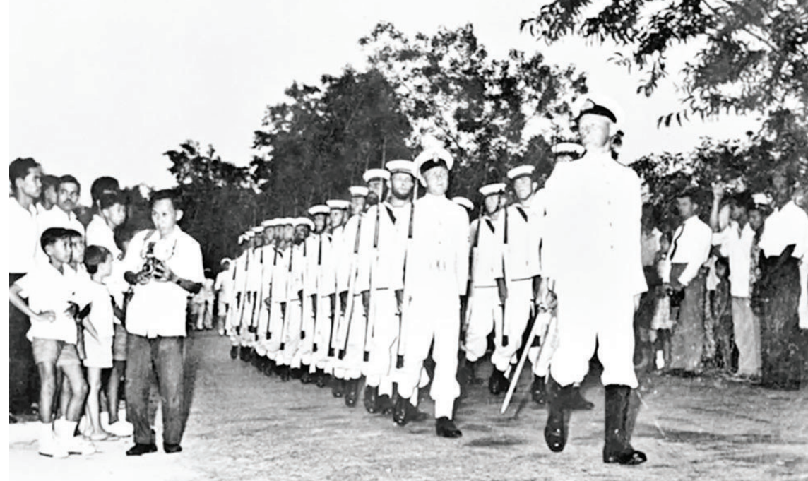
英国及英联邦部队胜利完成任务

万美元外汇储备的印尼却背负着27亿美元的债务。由此西方国家打算以债务问题为突破,召开债权国会议讨论对印尼的援助问题。