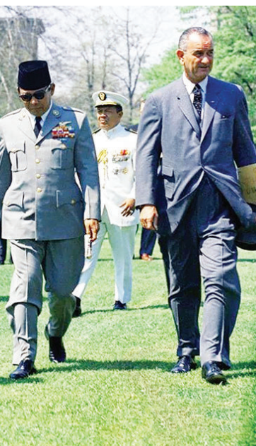
1961年,苏加诺与肯尼迪、约翰逊

国虽然实力强大,但因为摸不清印尼陆军的态度,于是便强推日本主导会议。而日本一直以来对东南亚虎视眈眈,即便是战败国,也要借着“劳务赔偿”的方式打开东南亚市场,是英国保留残存影响力的劲敌。