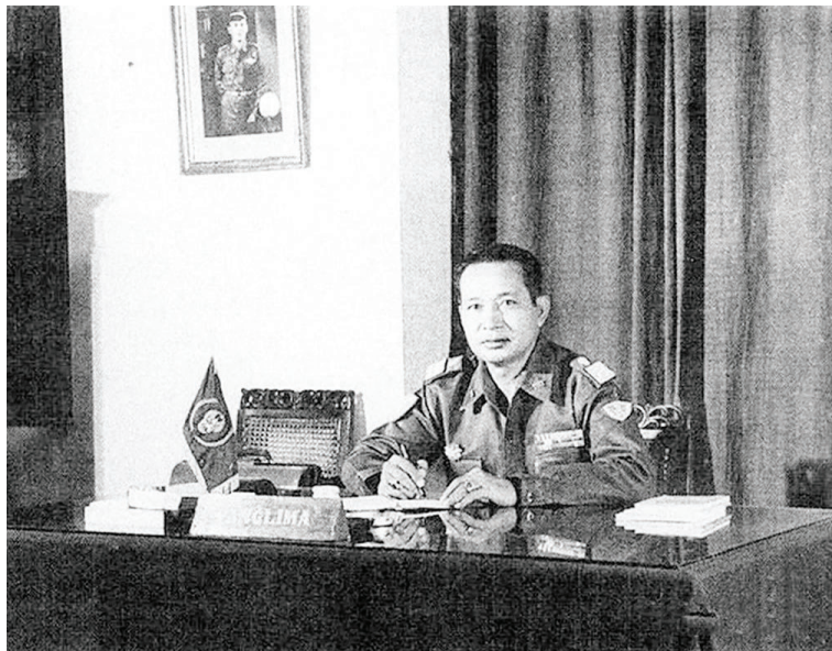
机会留给有准备的人(1963年的苏哈托)

于是英国试图拉拢西德为其火中取栗。可惜这一厢情愿没有得到只想闷声发财的西德的认可,无奈之下只好接受了美国的安排,由日