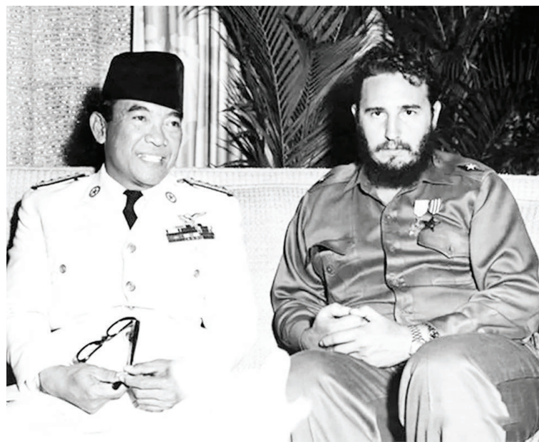
苏加诺可以和美国总统也可以和卡斯特罗交朋友