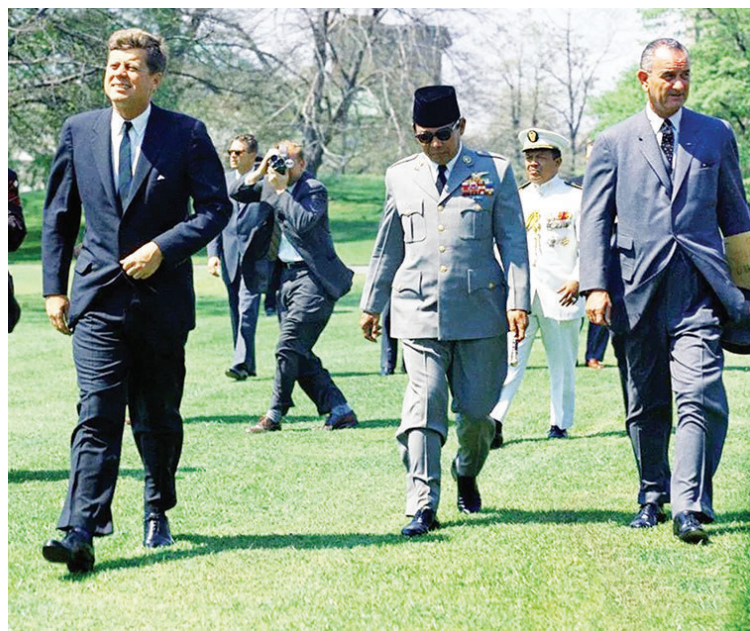
1961年,苏加诺与肯尼迪、约翰逊

将经济援助与其去留相联系的情况下。次年3月,陆军以武力向苏加诺逼宫,迫使其发表了放弃总统之位的“三月十一日命令”。第二天,苏哈托又以此命令为基础宣布解散印尼共产党,彻底掌握了政权。