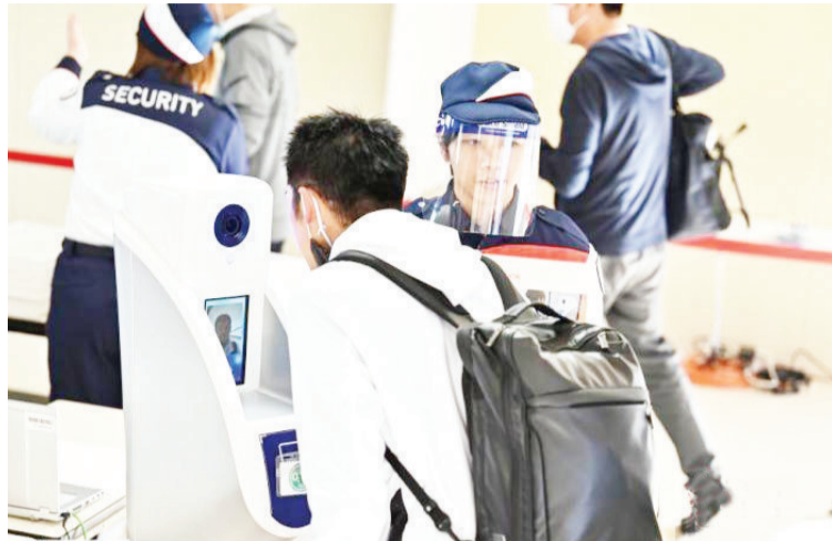
当地时间2020年10月21日,东京奥运会和残奥会组织委员会21日在东京向媒体公开了,观众等进入赛场时通过的行李安检区运营的实证试验。

而日本首相菅义伟在官邸被记者问及是否考虑放弃接纳时,他回答称:“政府并未开展探讨什么的。希望与IOC、东京都、奥组委携手,作为政府提供协助。” 五方磋商确认决心确保新冠对策万全,力争实现对参加者而言安全安心的奥运。鉴于出现变异新冠病毒,桥本示意有必要探讨追加性措施。丸川也表示:“日本国民对变异病毒的关注度非常高。将消除国内外对举办奥运的担忧,就举办一届安全安心的奥运开展广泛宣传。” 国际奥委会主席巴赫指出重点课题,强调称:“实现安全安心的奥运,进行公平的竞赛。这将成为