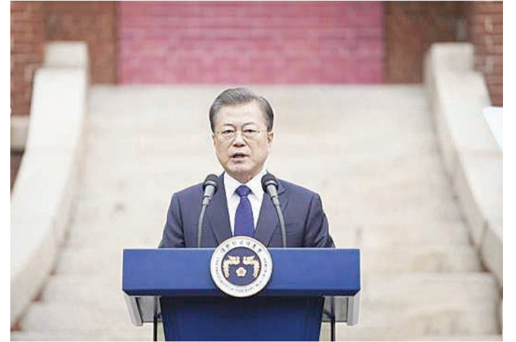
资料图:韩国总统文在寅。

3月3日,汪文斌在谈中美关系时还强调,希望美方客观理性看待中国和中美关系,采取理性务实的对华政策,同中方相向而行,多做有利于增进中美互信与合作的事,推动中美关系重回健康稳定发展轨道。