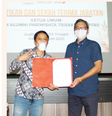
新旧主席职权交接仪式