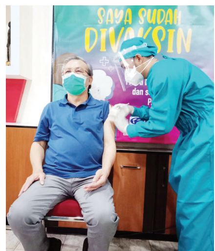
老年人正在接受疫苗接种