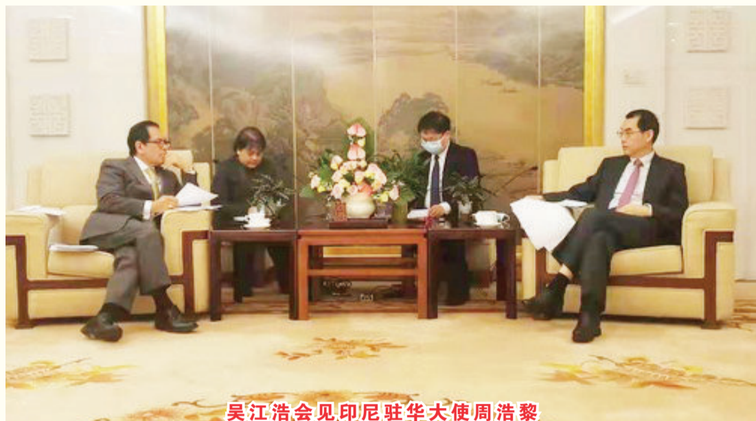
吴江浩会见印尼驻华大使周浩黎