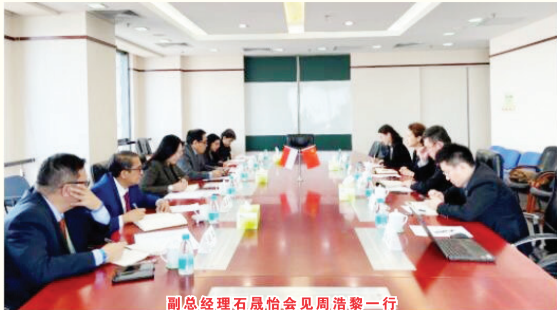
副总经理石晟怡会见周浩黎一行

【本报讯】据来自中国外交部网站消息：2021年3月3日，外交部部长助理吴江浩会见印尼驻华大使周浩黎。双方就双边关系、务实合作及共同关心的国际地区问题深入交换意见。