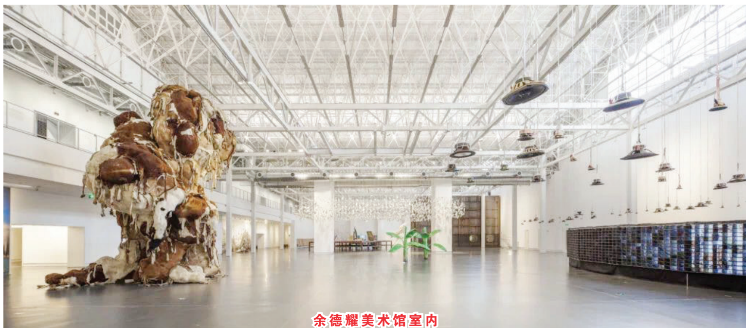
余德耀美术馆室内