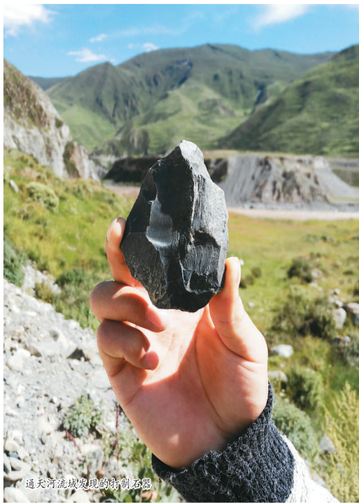
通天河流域发现的打制石器

存。”据侯光良教授介绍，以往的研究显示出青藏高原史前石器工业的多样性和复杂性，进一步指出人类早期向青藏高原扩散可能存在较大的时间跨度和多样化的扩散路线。目前，学术界占据主流的观点是人类从高原外的东北部扩散至青藏高原。相对而言，青藏高原东南部的科考工作较为薄弱，旧石器考古发现非常稀少。于是，在青海省自然科学基金项目、国家自然科学基金项目等项目联合资助下，侯光良教授、陈宥成副教授团队在2018、2019年夏季，对青藏高原腹地三江源地区通天河玉树—称多河段两岸进行了系统调查。