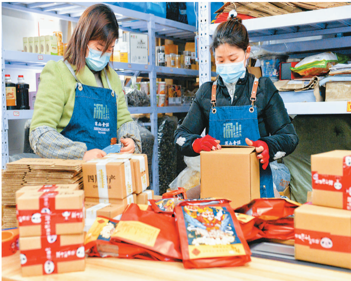
四川省巴中市通江县以“线上带货、线下展销”等销售模式，拓宽农产品市场营销渠道，助力乡村振兴。图为3月2日，通江县壁州创客一家电商企业员工正在打包农产品，通过物流销往外地。