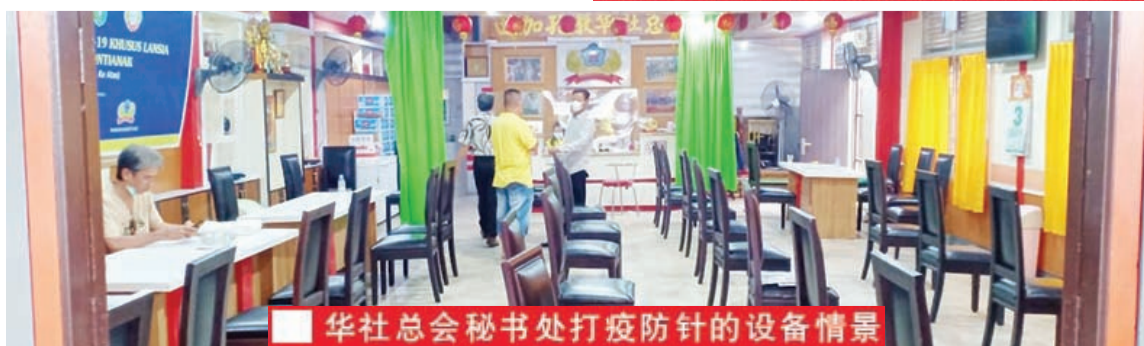
华社总会秘书处打防疫针的设备情景