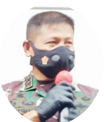
军区司令拉赫曼少将致词