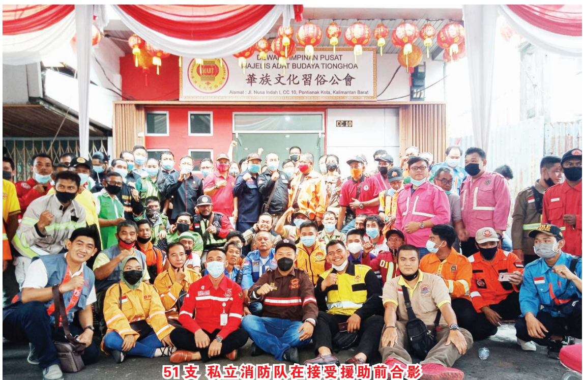
51支 私立消防队在接受援助前合影