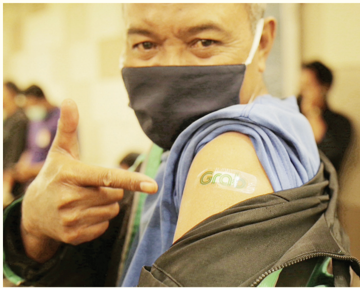
一名摩的司机接种疫苗