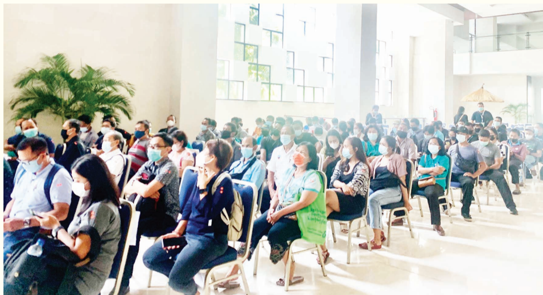
旅游从业人员在接种中心等候疫苗接种

中新社印尼登巴萨3月3日电(林永传 叶露)3日,设于印尼巴厘岛努沙杜瓦会议中心的疫苗接种中心已连续5天为该岛旅游从业人员接种新冠疫苗,共5000多名巴厘岛旅游从业者接种了来自中国科兴公司的疫苗。