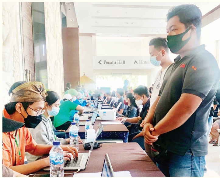
旅游从业人员登记个人信息等候疫苗接种