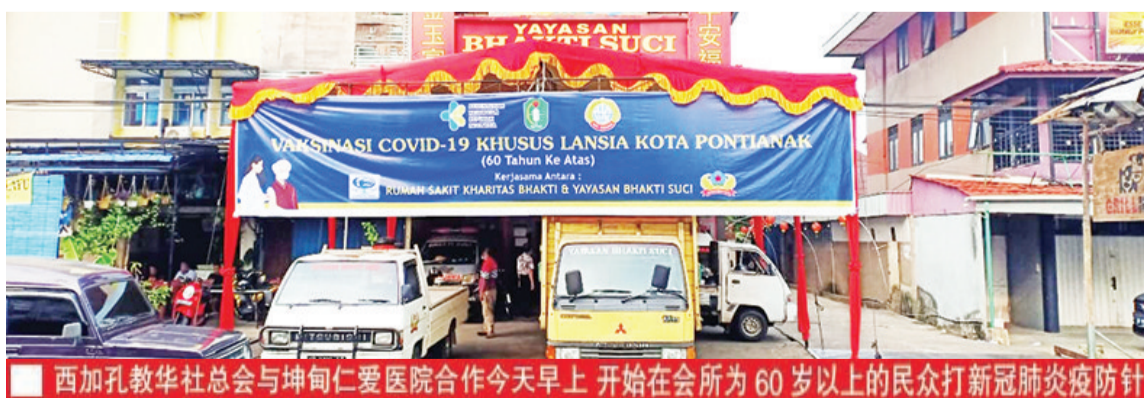
西加孔教华社总会与坤甸仁爱医院合作今天早上开始在会所为60岁以上的民众打新冠肺炎防疫针