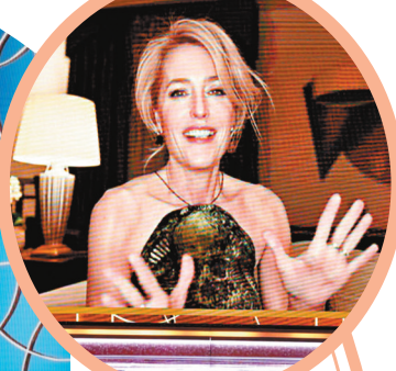
姬莉安德遜憑電視劇《王冠》奪得最佳女主角。