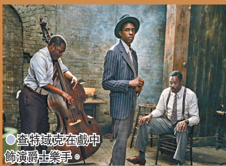
查特域克在戲中飾演爵士樂手。