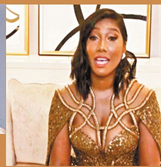
奧斯卡影后珍芳達獲頒終身成就獎時表現激動。

香港文匯報訊(記者 文芬)在新冠疫情下,美國影視界盛事第78屆金球獎前日公布結果,焦點落在華人女導演趙婷身上,她憑作品《浪跡天地》(Nomadland)獲得最佳影片大獎(劇情組),也憑藉此片獲得最佳導演獎,成為首位贏得金球獎的華人女導演,並視為問鼎奧斯卡主要獎項的大熱門!另外,去年因腸癌病逝的已故影星「黑豹」查特域克(Chadwick Boseman)則憑遺作《藍調天后》奪得劇情組影帝,其遺孀淚眼致詞感動人心。