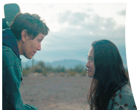
趙婷與法蘭絲麥杜曼合作非常愉快。

《浪跡天地》僅是趙婷第3部執導長片,由兩屆奧斯卡影后法蘭絲麥杜曼(Frances McDormand)主演,講述了一名在經濟大蕭條中失去一切的六旬女性,作為居住在房車裏的現代游牧民穿越美國西部的故事。《浪跡天地》好評席捲全球,一舉成為各大電影權威媒體所評論的「年度最佳電影」,《Evening Standard》將此片譽為「非同凡響!一部撼動人生的曠世鉅作!」《The Daily Telegraph》則大讚本片「極度親密,壯麗懾人!」《Entertainment Weekly》更視此片為「具必要性的高超傑作!」