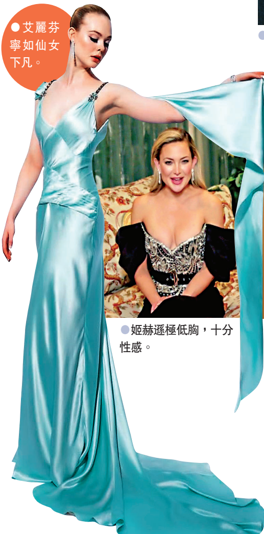
艾麗芬寧如仙女下凡。