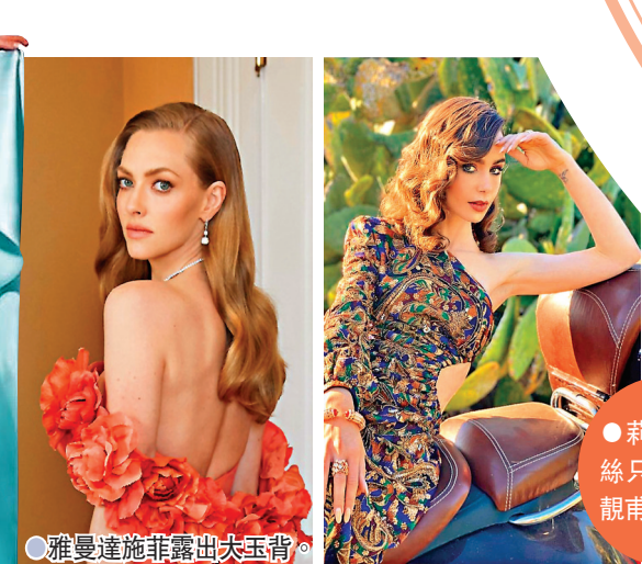
雅曼達施菲露出大玉背。