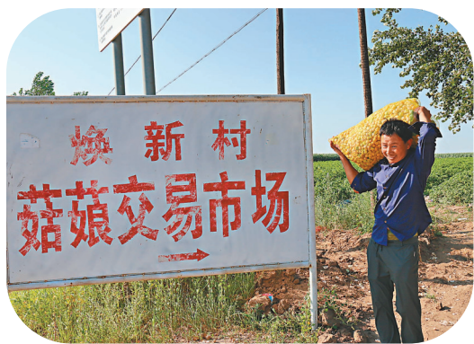
● 因來往客商較多，換新村有黃菇娘交易市場。