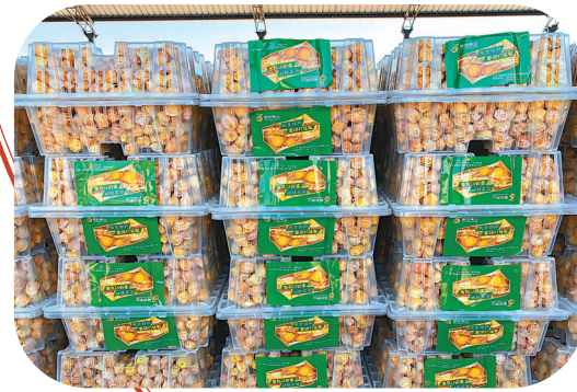
▲ 黃菇娘又稱燈籠果。圖為包裝好準備送去市場銷售的黃菇娘。