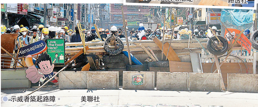
● 示威者築起路障。

此外，昂山由於被控使用非法進口的通訊設備，當局亦額外依據《電訊法》第67條對她提出多一項指控。相關案件將於3月