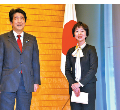
● 山田真貴子(右)因接受招待辭職。

對象，因此早前已表示將主動退還6成月薪，然而批評聲未有因此停止。菅義偉1日在國會接受質詢時透露，山田當晚因「身體不適」送院，其後在醫院向內閣官房副長官杉田和博表達辭意，他唯有接受。菅義偉說，「針對我的家人跟此事有關，結果造成公務員違反倫理法，我感到非常抱歉，要向全體國民深深致歉」。他說，造成國民對行政單位信賴大幅下降的事態，「我也必須深刻反省」。