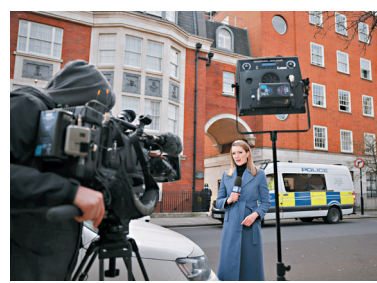
● 記者在醫院外報道。

上月入院接受感染治療的英國王夫菲臘親王留醫近兩個星期後，1日轉送到一所專門治療心臟疾病的醫院，王室表示菲臘轉院是為了就原有心臟毛病接受檢查，最少需要留醫至本周末，未有透露更多詳情。