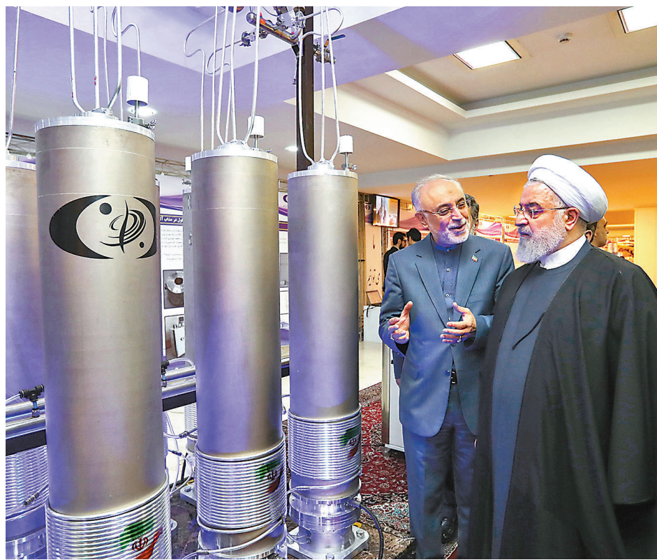
● 伊朗在多番抗議後，2月28日宣布拒絕重返談判桌。圖為魯哈尼於2019年到訪當地核子研究設施。

美國白宮發言人回應表示失望，聲明中說，美方隨時準備參與有意義的外交活動以實現雙方共同遵守伊核協議的承諾。美方將與英國、