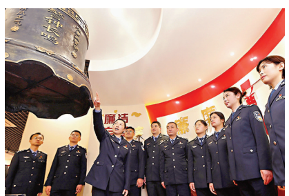
●2月4日，江蘇南京港出入境邊防檢查站「廉講堂」在廉政警示教育展覽廳開講。

年輕幹部要有「檢身若不及」的自覺，經常對照黨的理論、對照黨章黨規黨紀、對照初心使命、對照黨中央部署要求，主動查找、勇於改正自身的缺點和不足。要涵養虛心接受批評的胸懷和氣度。