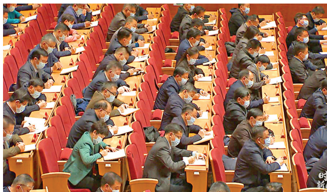
▲開班式現場。 央視新聞客戶端

2019年3月1日，習近平在中青班首次「開講」時說，培養選拔優秀年輕幹部是一件大事，關乎黨的命運、國家的命運、民族的命運、人民的福祉，是百年大計。建黨百年之際，面對百年未有之大變局、面對第二個百年奮鬥目標……年輕幹部們，征途漫漫，惟有奮鬥！