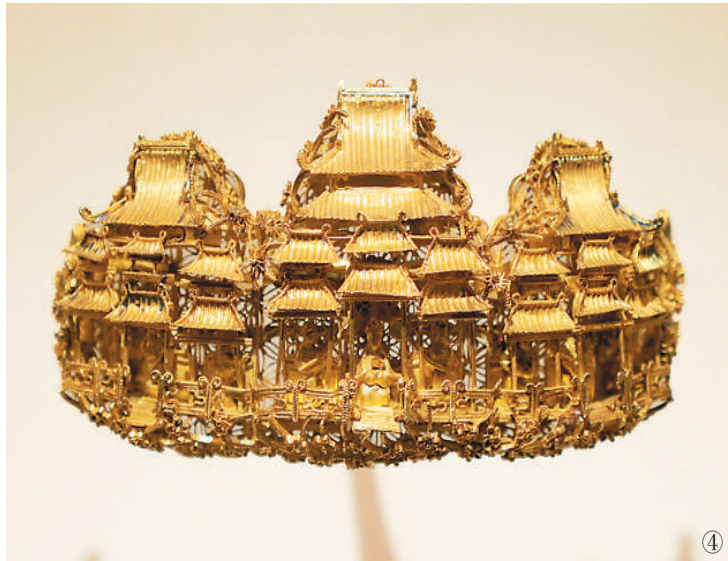
图①：展厅里的沉浸式体验空间 图②：唐代戴冠冠三彩俑 图③：唐代着半臂女侍俑 图④：明代楼阁人物金簪