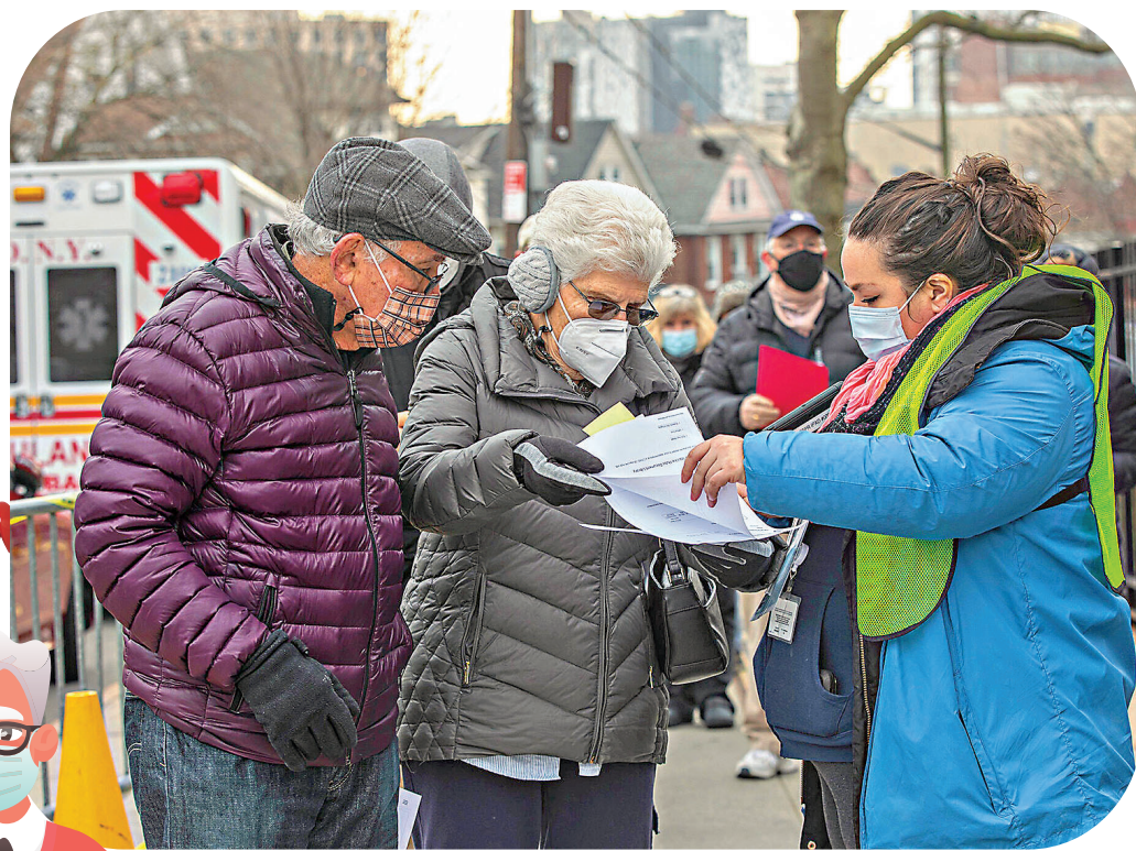
● 美國預約打針系統複雜，不少長者都感到困難。

香港上周啓動新冠疫苗接種計劃，不過市民需要提前網上預約，對部分長者而言可能不太方便。類似情況在美國都出現過，為了方便和鼓勵長者接種，當地志願團體便積極與政府部門合作，提供協助長者預約服務，包括設立打針熱線讓長者致電預約，或者代長者預約打針等，官民齊心一致加快整體接種速度。