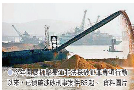
●今年開展打擊長江非法採砂犯罪專項行動以來，已偵破涉砂刑案件85起。資料圖片

中國公安部治安管理局副局長張曉鵬亦表示，為實現對長江非法採砂犯罪精準有效打擊，徹查全案要素及關聯犯罪，公安機關將對在偵案件和前期已結重點案件開展「回頭看」，嚴格落實「一案七查」工作要求，即圍剿夥構成必查、作案船舶必查、偽造證件必查、犯罪所得必查、販銷網絡必查、隱案積案必查、涉黑惡保護傘必查，確保每起案件查細查實、打深打透。