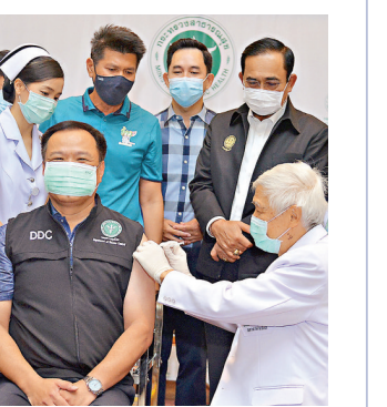
●2月28日，泰國總理巴育(後排右二)在曼谷見證副總理兼公衛衛生部長阿努廷(前左)接種中國科興新冠疫苗。

杜特爾特致辭表示：今天我們收到了來自中國的新冠疫苗，抗擊新冠病毒的鬥爭又向前邁進了一步。我向中國人民和中國政府表示誠摯的感謝，感謝他們的友好和團結——這是菲中夥伴關係的標誌。