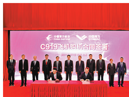
●3月1日，東航與商飛在滬正式簽署C919購機合同。香港文匯報記者夏微攝

香港文匯報訊 據環球網報道，據中國東方航空公司官方微信號「MU東東腔」消息，3月1日，中國東方航空與中國商飛公司在上海正式簽署C919大型客機購機合同，首批引進5架，成為全球首家運營C919大型客機的航空公司。