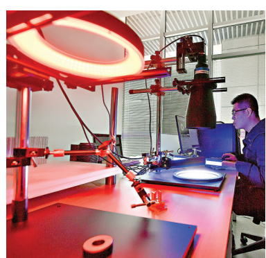
●在清華大學天津高端裝備研究院複合製造與智能識別研究所，工程師在測試智能識別光學系統。

「十三五」期間，中國發布285項智能製造國家標準，主導制定47項國際標準，涵蓋了企業生產製造的全流程，中國進入全球智能製造標準體系建設先進行列。建成600多個具備先進水平的智能工廠，智能製造示範項目生產效率平均提高44.9%，能源利用率提升19.8%，運營成本降低25.2%，產品研製周期縮短35%，產品不良品率降低35.5%。新增兩化融合管理體系貫標企業超過3萬家，煉化、印染、家電等領域接近國外先進水平。工業互聯網網絡、平台、安全三大體系夯基築樑工作基本完成。定製化服務、全生命周期管理、總集成總承包、共享製造、在線監測與維護等服務型製造新模式不斷湧現，工程機械、電力裝備等行業服務型製造業務快速發展，工業設計、信息技術、節能服務等生產性服務業逐步壯大。