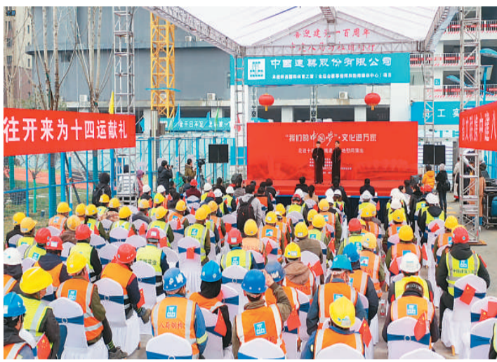
2月26日,文化进万家文艺志愿服务队走进陕西国际体育之窗项目工地。该项目由中建八局西北公司承建,是2021年第十四届全运会配套项目。春节期间,项目的千余名建设者“就地过年”,奋战在施工一线。

国务院国有资产监督管理委员会日前发布的数据显示,“十三五”期间,中央企业资产总额连续突破50万亿元、60万亿元关口,去年底为69.1万亿元,接近70万亿元,年均增速达到7.7%。国务院国有资产监督管理委员会主任郝鹏指出,“十三五”期间,中央企业交出了一份比较优异的成绩单。今年提出了中央企业的经营目标,就是要推动中央企业净利润、利润总额增速要高于国民经济的增速,营业收入利润率、研发投入强度、全员劳动生产率都要有明显提高,同时还要保持资产负债率的稳健可控。引导企业更加突出主责主业,聚焦提质增效、聚焦改革创新,确保更好地实现高质量发展。