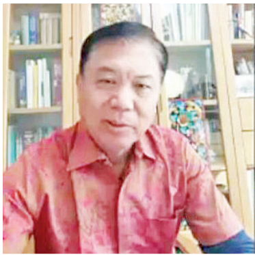
中国驻登巴萨前总领事苟皓东先生线上发言