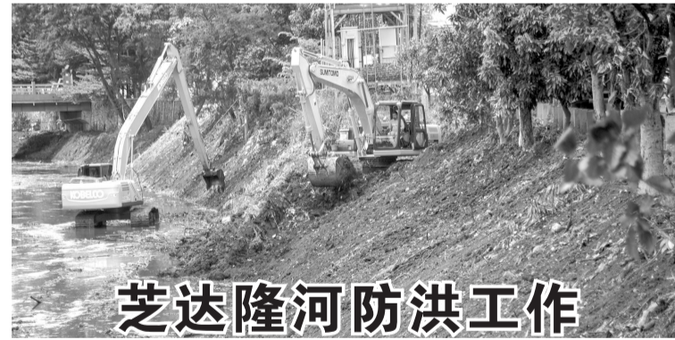
芝达隆河防洪工作 3月1日,为防范芝达隆河在雨季泛滥成灾,工人在万隆 Cikelei 河正用挖土机挖深河道。

另外,根据中国国药集团(Sinopharm)中国生物北京研究所公布的三期临床试验期中分析数据,免疫程序两剂接种后,中和抗体阳转率为99.52%,疫苗保护效力为79.34%。这说明,接种疫苗并非让每个人百毒不侵,或者能百分百地让人免遭病毒入侵,因此谨慎行动是必须的。(Sm)