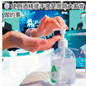
● 使用酒精搓手液是現時大家常做的事

現在研究發現，新冠肺炎可通過接觸傳播和飛沫傳播，因此日常皮膚的清淨衛生不容忽視，特別是必須認真進行手部的清潔消毒。清潔手部皮膚的第一步是洗手，但由於清水無法去除脂肪、油、蛋白質等常見的污染成分，所以需要消毒劑。在做消毒時首選使用含氯、乙醇、過氧化氫等成分的消毒劑。洗手過程中的頻繁清潔、消毒手部皮膚會破壞皮膚屏障結構，改變皮脂膜的PH值，從而導致手部發生皮膚乾燥、瘙癢、脫皮等情況。