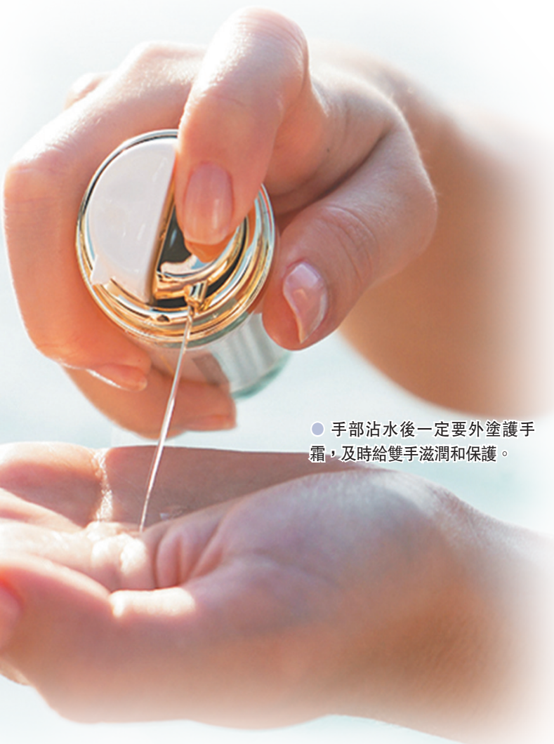
● 手部沾水後一定要外塗護手霜，及時給雙手滋潤和保護。