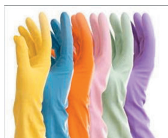
● 在日常家居消毒或做家務的時候，選定專用手套。

六、定期進行手部保養：面部肌膚可以通過敷面膜進行保養，手部皮膚也可以外敷手膜進行深度養護。如果沒有手膜，可以將面膜敷在手部10至15分鐘；也可以用質地比較滋潤的護手霜厚厚地敷在手上，然後戴上一次性塑膠手套，大約15至20分鐘後取下。以上的方法都可以達到補油、鎖水、滋養的效果。