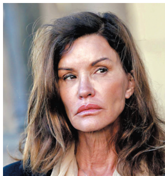
●66歲 Janice Dickinson 容顏憔悴，嘴唇人造痕跡尤其顯著！