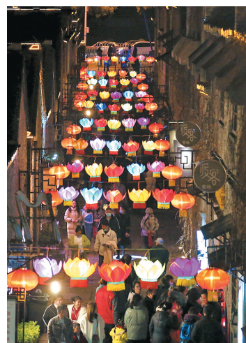
●花燈璀璨迎元宵。

這令我想起過年的傳說。兇獸的年獸在年夜跑出來吃人，大家都非常害怕。有人知道年獸最怕響亮的聲響，便在牠來襲時點燃炮仗。年獸聽到砰砰的炮仗聲，嚇個落荒而逃。家家戶戶在翌天打開門時，見到街坊鄰里還健在，沒有被年獸吃掉，便跟對方說恭喜恭喜。原來在拜年時向對方說恭喜恭喜本來的意思是：「你還沒死去嗎？真的要恭喜你了。」(一笑)