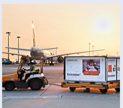
●新冠病毒疫苗儲運條件為2℃至8℃，對運輸時效性要求較高。

日前，交通運輸部已出台疫苗運輸車輛免費通行政策，對持有調運單的疫苗貨物運輸車輛，實施免費、不停車、便捷通行政策。