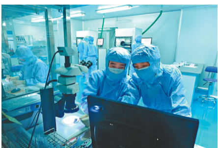
●康希諾疫苗對重症的保護效力分別為，單針接種疫苗28天後為90.07%；單針接種疫苗14天後為95.47%。