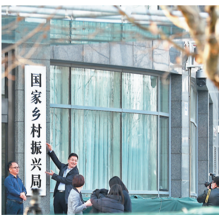
●2月24日，國家鄉村振興局正式掛牌，國務院任命王正譜為國家鄉村振興局局長。