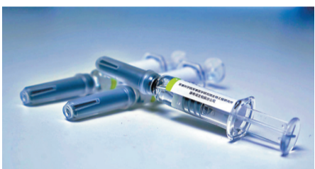
●康希諾疫苗是目前國內附條件上市唯一一款單針接種疫苗。