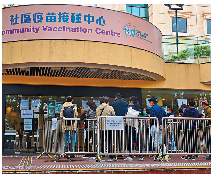
●2月26日，香港正式展開新冠疫苗接種計劃，已預約的市民到位於銅鑼灣中央圖書館展覽館的社區疫苗接種中心接種科興新冠疫苗。