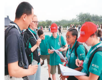
2019年，英国“中文培优项目”学生在中国参加“2019年汉语桥——英国培优项目来华夏令营”。