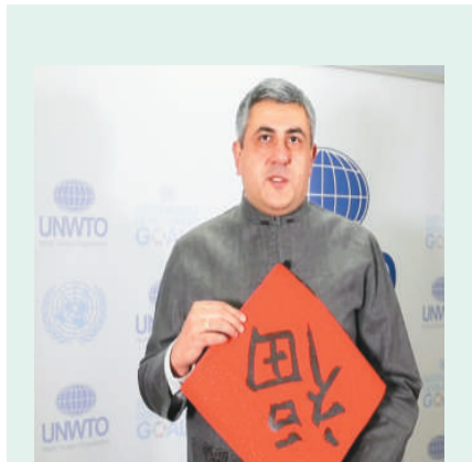
联合国世界旅游组织秘书长祖拉布·波洛利卡什维利送上了祝贺。

中文的实用性并不只体现在旅游业，2019年国际中文教育大会首设“中文+职业技能”论坛，邀请中外企业与教育专家共同讨论如何开展就业创业对接，正是顺势而为。此举引发不