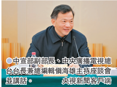
●中宣部副部長、中央廣播電視總台台長兼總編輯慎海雄主持座談會並講話。央視新聞客戶端

《典籍裏的中國》第一期節目在今年春節隆重推出後,迅速引發破圈層傳播,成為現象級傳播產品。目前,節目的網絡視頻播放量超過 1.6 億次,微博相關話題閱讀量超 7 億次。網友和媒體紛紛盛讚該節目「傳播文化自信」「震撼人心」。●央視新聞客戶端