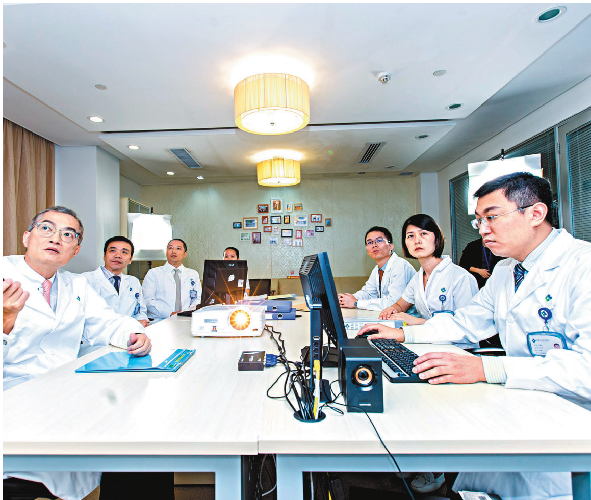
●據香港文匯報記者了解,港大深圳醫院已有三十餘名香港醫生獲得內地執業資格認證。圖為港大深圳醫院的住院醫師規範化培訓。

此外,深圳還在探索逐步建立香港職業資格與深圳市職稱的對應關係。目前,已獲得香港測量師(產業測量組)資格的專業人士,可按照房地產估價師相關規定申報高級經濟師職稱;已獲香港規劃師協會資深會員或會員資格的專業人士,可按註冊城鄉規劃師相關規定申報相應的高級工程師職稱。