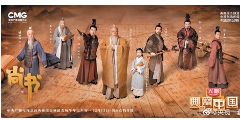
●大年初一,中央廣播電視總台文化經典系列節目《典籍裏的中國》首播。

節目主創代表、中國國家話劇院演員倪大紅在節目中飾演《尚書》護書人、傳人伏生。他表示,節目讓伏生看到了兩千多年後《尚書》還在被傳承,這種告慰的方式不僅