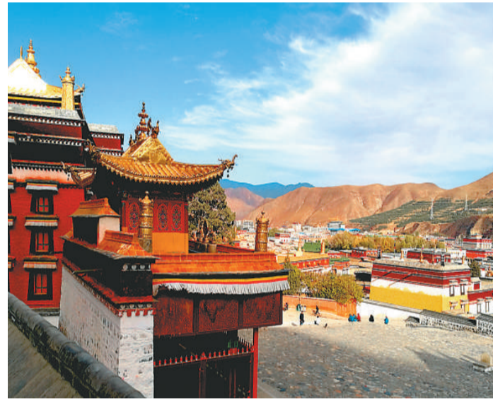
本文图片：拉卜楞寺风光

从弥勒佛殿出来，天快黑了，我们只好从寺内出来，住进离寺院最近的卓玛旅店，房间虽小，但很