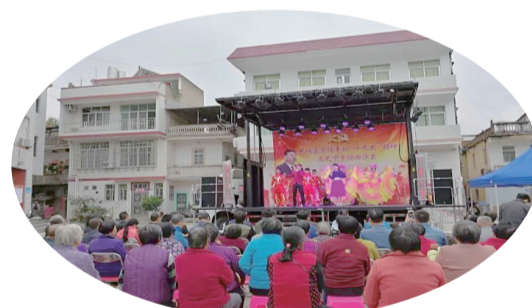
▲下鄉開展文化活動

“十三五”時期，大埔縣不斷加大力度，推動文化事業發展，通過開展各種豐富多彩的文化活動，推動公共文化資源下沉，打造出了活動多多、舞臺滿滿的文化大埔。