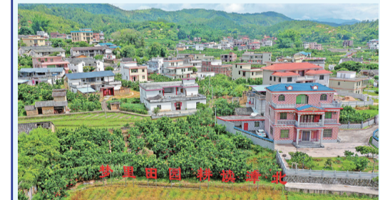
▲漳北村入選廣東十大美麗鄉村

2020年，大埔縣堅持統籌協調，大力推動新型城鎮化，不斷提升人居環境，城鄉面貌日益改善。這一年，大埔以踐行之力，統籌城鄉發展。持續抓好“鞏文創衛”和“兩美行動”，完成大埔大道等十二條道路（一期）和大興路提升改造工程，拆除虎源路“攔路房”，打通內環東路、文化路、梅潭河堤嶺下段“斷頭路”，奧園商業廣場建成開放，榮獲“國家衛生縣城”稱號。 西河鎮成功創建省級生態宜居美麗鄉村示範鎮，漳北村入選“廣東十大美麗鄉村”，北塘藝術部落入選省休閒農業與鄉村旅遊示範點，全縣245個行政村達到幹淨整潔村標準，其中123個行政村達到美麗宜居村標準，楓朗鎮紅色黨建引領綠色發展示範帶得到省市領導充分肯定，城鄉面貌日新月異、越來越美。（大埔縣融媒體中心）