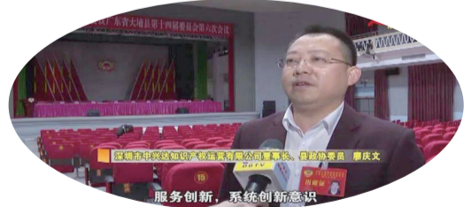
政府工作報告指出，2021年，大埔要

強力推進招商引資，深入實施“鄉賢回鄉投資興業工程”，用好商會、展會、鄉賢等資源，推動“客商回歸”工作常態化、項目化，力爭全年引進億元以上項目15個；力爭更多項目落地，提升企業創新能力，打造更加強勁的發展引擎，推動大埔經濟社會更好更快發展。