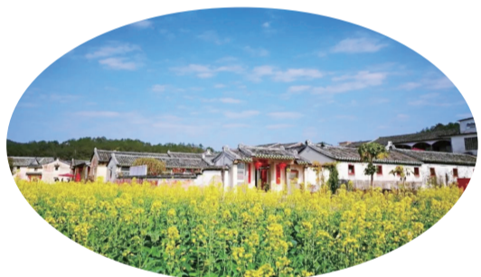
▲大埔文旅康養產業發展喜人

2021年是“十四五”開局之年，一幅嶄新的發展藍圖正等待着大埔人民共同奮力繪就。站在新起點上，大埔將大力發展製造業，發展壯大文旅康養產業，助推大埔經濟社會更好更快發展。