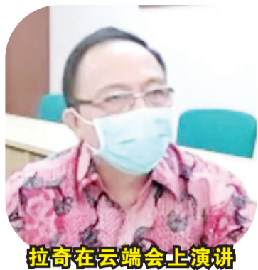
拉奇在云端会上演讲

【本报讯】2021年2月17日，力宝集团旗下力宝芝卡朗(Lippo Cikarang)主办的云端房地产讲座会，“雅加达东部走廊房屋投资良机”。