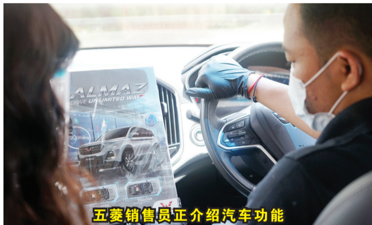
五菱销售员正介绍汽车功能

【本报讯】2021年2月25日，五菱作为印尼的汽车制造商之一，在疫情大流行期间，尤其是在汽车领域，为提供支持印尼经济复苏，五菱(印尼)汽车