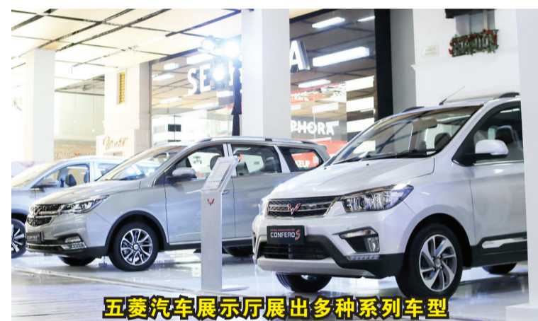
五菱汽车展示厅展出多种系列车型

此外，五菱汽车商还通过开展各种促销活动来开展“新兴奋”活动，例如4年或50,000公里的免费维护费(以先达到的为准)，还有价值Rp.3,000,000,-印盾的折价券和在使用期限内，由五菱金融支持的免费汽车保险(附条款和条件适用)。