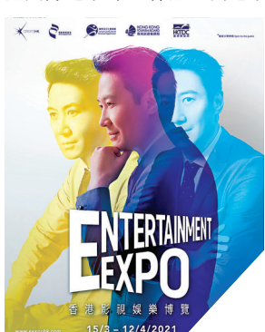
●黎明為大會拍攝了全新宣傳海報。

香港文匯報訊 黎明早前應香港貿發局邀請，續任第17屆香港影視娛樂博覽 (Entertainment Expo、簡稱EE) 的宣傳大使，並為大會拍攝了全新宣傳海報。黎明表示：「疫情為影視娛樂業帶來新常態，能在此時此刻再次擔任香港影視娛樂博覽 (EE) 的宣傳大使，為推動本地業界出一份力，實在別具意義。」今年EE將於3月15至4月12日舉行，六大項目包括香港國際影視展 (線上展)、香港國際電影節、香港亞洲電影投資會 (IAF)、ifa 獨立短片及影像媒體節、數碼娛樂論壇，以及亞洲影視論壇。