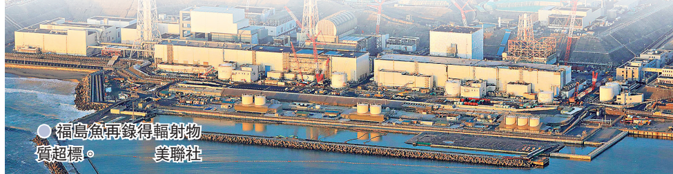
● 福島魚再錄得輻射物質超標。