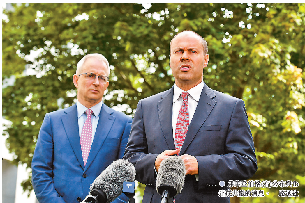
● 弗萊登伯格(右)公布與fb達成共識的消息。

今次修改的4項條文，包括fb和Google強烈反對的仲裁機制，澳洲政府同意增設為期兩個月的調解期，容許科企與媒體在仲裁員介入前，協商達成協