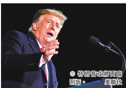
● 特朗普或將面臨刑訴。

駁回共和黨在5個州份共8項訴訟，其中包括共和黨反對延長賓州接收和點算郵寄選票期限的上訴。