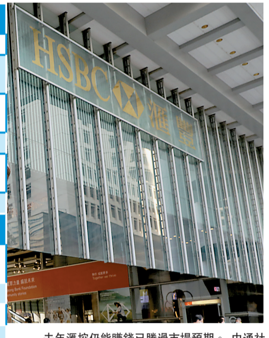
去年滙控仍能賺錢已勝過市場預期。

英倫銀行對銀行業恢復派息「開綠燈」，滙控連續四個季度停止派息後，終於恢復在2020年度派發一次末期息，每股15美仙(折合約1.16港元)，符合市場預期，亦不設以股息選擇項。 滙控亦預告，今年將不會按季度派息，最快要到8月公布中期業績時，才考慮是否派一次股息。另亦計劃逐步將目標派付比率，設定在列帳基準每股普通股盈利的40%至55%之間，以實現可持續派息政策。滙控又指，2022年底前不會重啟回購股份。