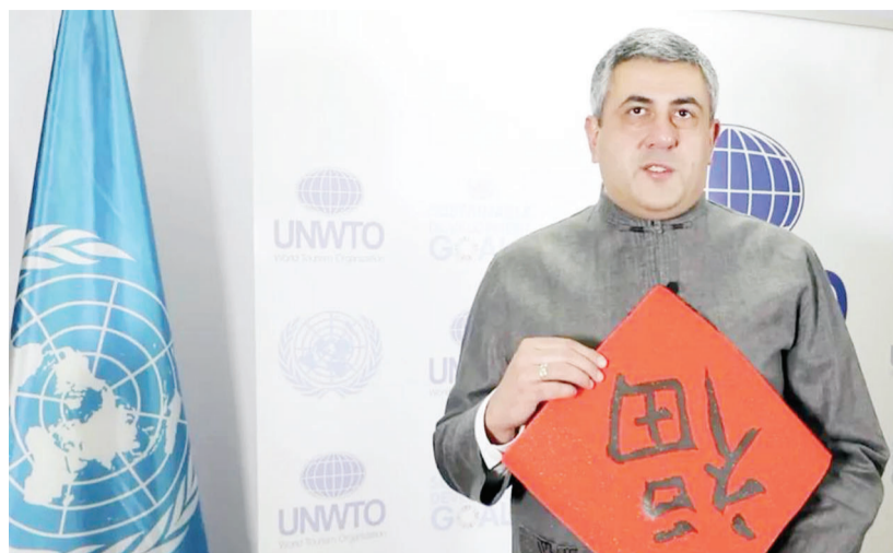
联合国世界旅游组织秘书长祖拉布·波洛利卡什维利专门制作了视频以示祝贺

根据UNWTO章程规定,该修正案经全体大会通过后,尚须三分之二以上成员国履行批准手续后方可生效。自2007年修正案通过以来,为推动各成员国尽快履行批准手续,促成中文成为UNWTO官方语言早日生效,中方联合UNWTO做了大量工作。2021年1月,修