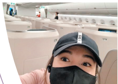
● 李施嬅於加拿大完成工作後即返港。