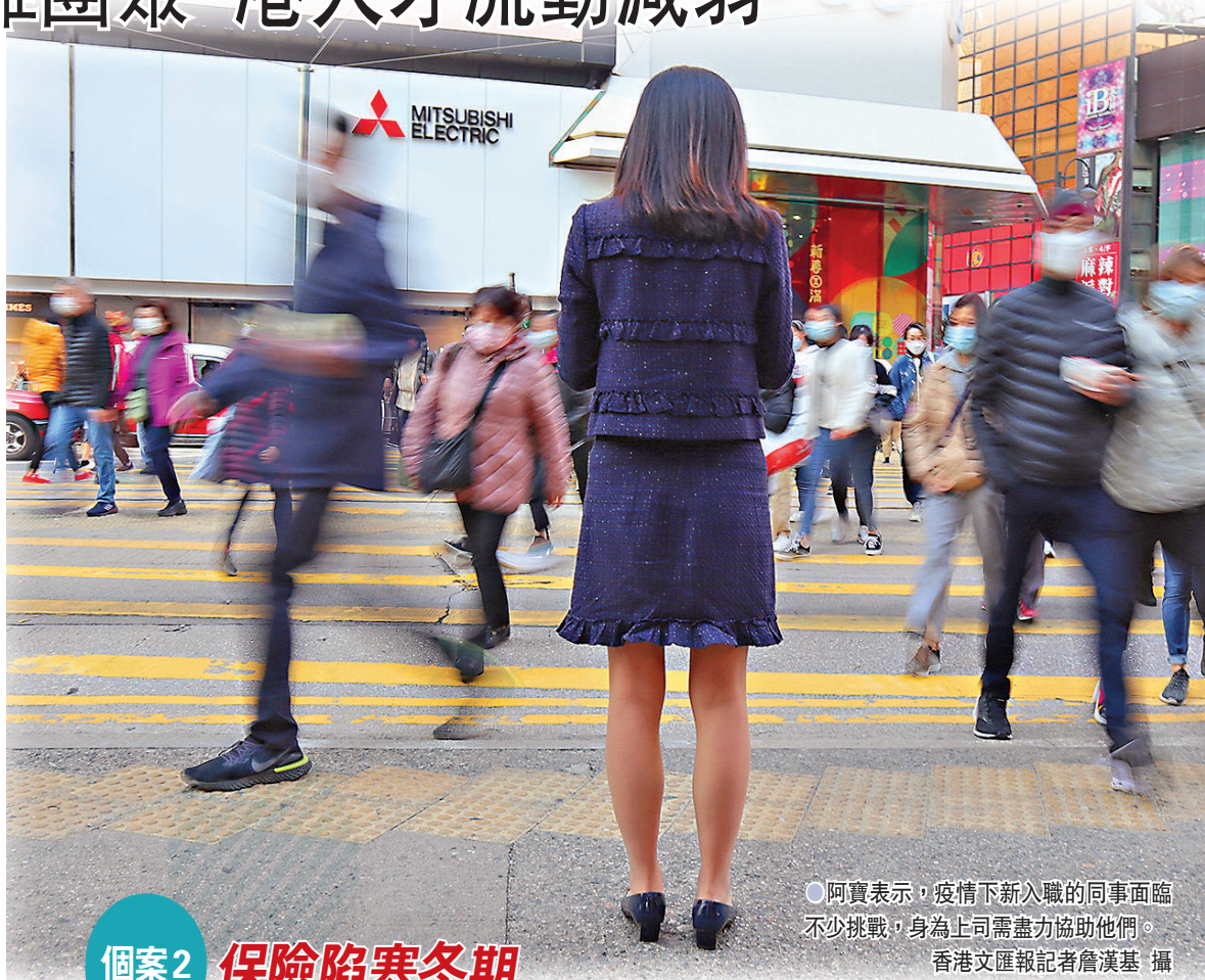
●阿寶表示，疫情下新入職的同事面臨不少挑戰，身為上司需盡力協助他們。 香港文匯報記者詹漢基 攝

●Amber提到，面對暴疫打擊，個人諮詢、企業招聘業務都明顯減少。 香港文匯報記者詹漢基 攝