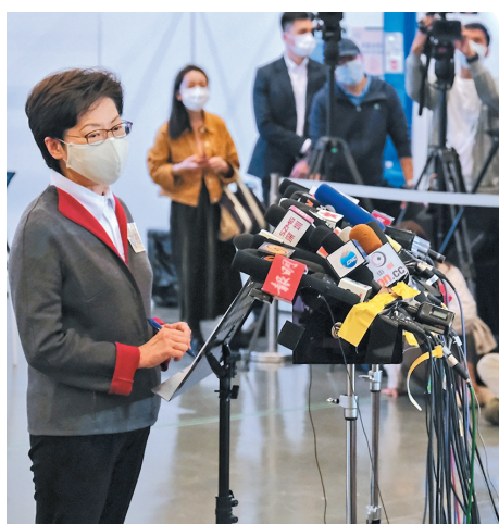
●林鄭月娥表示，改革選舉制度就是要打擊鼓吹「港獨」、過去將香港推向萬丈深淵的暴力者、勾結外國勢力的人。

香港文匯報訊(記者 鄭治祖)全國政協副主席、國務院港澳辦主任夏寶龍23日在全國港澳研究會舉行的研討會上發表講話，闡述了有關「愛國者治港」和香港特區管治原則。香港特區行政長官林鄭月娥23日對夏寶龍講話作出四點回應，包括「愛國者治港」是成功貫徹落實「一國兩制」的必然和必要條件，要求「愛國者治港」並非很高的標準，中央行使權力是義不容辭亦是理所當然，政治體制的問題是中央的事權。她表示特區政府非常尊重中央在政治體制方面的主導權，並會做出全面配合。