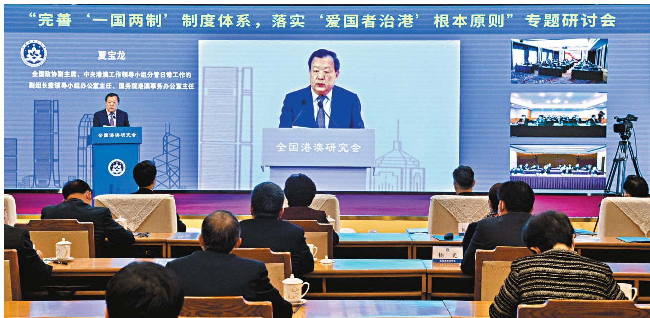
●夏寶龍23日出席「完善『一國兩制』制度體系，落實『愛國者治港』根本原則」專題研討會並發表講話。