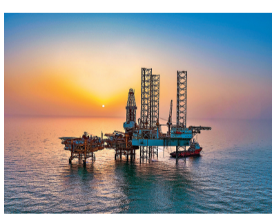
●中國渤海再獲大型油氣發現一渤中13-2油氣田，探明地質儲量億噸級油氣當量。

香港文匯報訊 據新華社報道，記者22日從中國海油獲悉，中國渤海再獲大型油氣發現一渤中13-2油氣田，探明地質儲量億噸級油氣當量，進一步夯實了中國海上油氣資源儲量基礎，對海上油氣田穩產上產、保障國家能源安全具有重要意義。