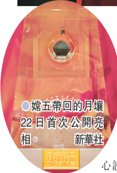
●嫦娥五號帶回的月壤22日首次公開亮相。