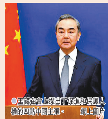
●王毅在會上提出了促進和保護人權的四點中國主張。

王毅指出，香港國安法彌補了香港地區在維護國家安全方面長期存在的法律漏洞，開除了香港形勢由亂及治的重大轉折，有利於「一國兩制」實踐行穩致遠，也保護了香港居民根據基本法所享有的合法權利和自由。我們對香港的未來充滿信心。