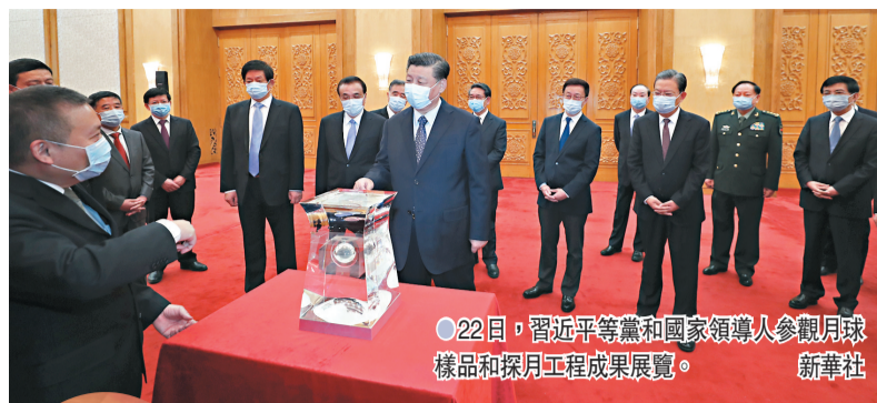
●22日，習近平等黨和國家領導人參觀月球樣品和探月工程成果展覽。

實施探月工程是黨中央把握中國經濟科技發展大勢作出的重大戰略決策，工程自立項以來圓滿完成六次探測任務。嫦娥五號任務作為中國複雜度最高、技術跨度最大的航天系統工程，於2020年12月17日首次實現中國地外天體採樣返回，為未來中國開展月球和行星探測奠定了堅實基礎。