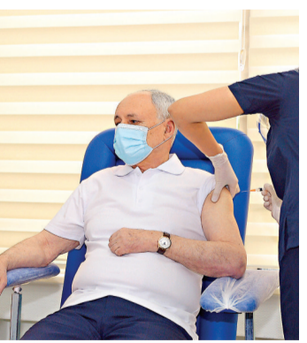
●阿塞拜疆衛生部長奧格塔伊·希萊里耶夫日前接種中國新冠疫苗。