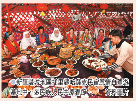
●新疆塔城地區托里縣哈薩克民族風情自釀遊藝基地中，多民族人民共慶春節。