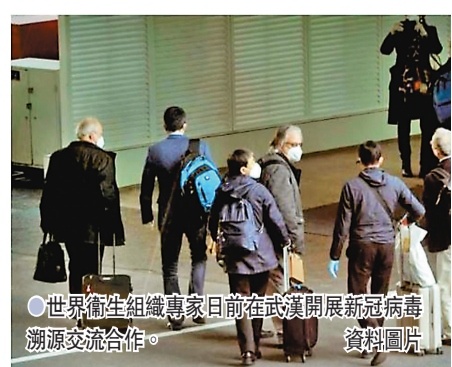
●世界衛生組織專家日前在武漢開展新冠病毒溯源交流合作。

文章最後說，新冠病毒溯源國際專家組已完成全球病毒溯源中國部分的工作，報告的最終詳細版本將於未來幾周內公布。